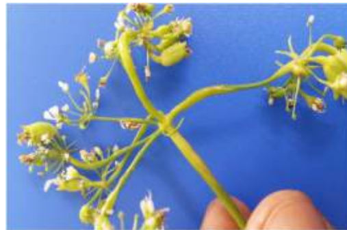
रोग के लक्षण