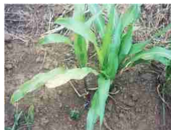
मोलिब्डिनम की कमी से मक्का की फसल पर लक्षण

मोलिब्डिनम की कमी को दूर करने के उपाय : मोलिब्डिनम की कमी को मृदा में मोलिब्डिनम रसायन डालने या पौधों पर स्प्रे करने से दूर किया जा सकता है। मोलिब्डिनम की कमी को मृदा का पी. एच. चुने द्वारा उपयोग कर दूर किया जा सकता है। शुष्क दशाओं में उगाई जाने वाली फसलों के लिए मोलिब्डिनम रसायन डालने की अपेक्षा उनका पत्तों पर छिड़काव करना ज्यादा लाभदायक पाया गया है। अधिकांश तौर पर मोलिब्डेट तथा सोडियम मोलिब्डेट का उपयोग किया जाता है। क्योंकि यह दोनों रसायन पानी में घुलनशील हैं।