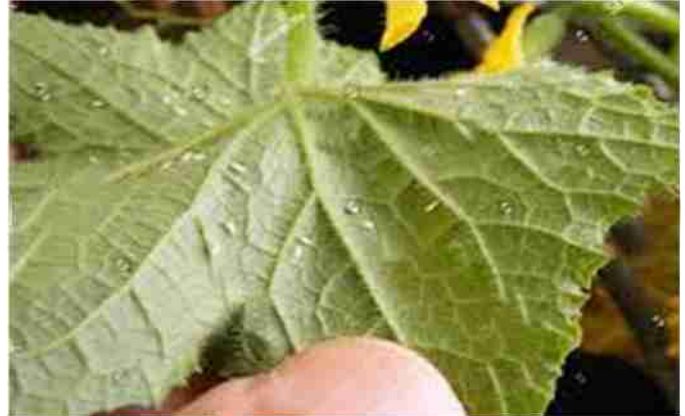
सफेद मक्खी के प्रकोप से ग्रसित पत्तियाँ

पहचान : इस कीट की मक्खी सफेद रंग की होती है और बहुत ही छोटी होती है। सफेद मक्खी की मादा पत्तों की निचली सतह में 150 से 250 अंडे देती है। ये अंडे बहुत महीन होते हैं जिन्हें नंगी आंखों से नहीं देखा जा सकता। इन अंडों से 5 से 10 दिनों में शिशु निकलते हैं। शिशु तीन अवस्थाओं को पार कर चौथी अवस्था में पहुंचकर प्यूपा में परिवर्तित हो जाते हैं। प्यूपा से 10 से 15 दिनों बाद में वयस्क निकलते हैं और जीवनचक्र फिर से आरंभ कर देते हैं।