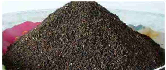
मृदा पोषण का खजाना वर्मीकम्पोस्ट

बाहर निकल जाये। इसके बाद पात्र में वर्मीबैड तैयार किया जाता है। वर्मीबैड में सबसे नीचे वाले परत में छोटे-छोटे पत्थर, ईट के टुकड़े व मोटी रेत 3.5 सें.मी. की मोटाई तक डाली जाती है, ताकि पानी का वहन ठीक प्रकार से हो। इसके बाद इसमें मिट्टी की एक परत दी जाती है, जो कम से कम 15 सें.मी. मोटाई की होनी चाहिए। इसे अच्छी तरह गीला किया जाता है।