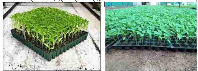
प्रो-ट्रे में पौध तैयार करना

500 वर्ग मीटर क्षेत्र वाले साधारण हरितगृह में एक बार में 2.0 लाख तक विभिन्न प्रकार की सब्जियों की पौध तैयार करना संभव है। इससे वर्षभर में 6 से 8 किशतों में पौध तैयार करना भी संभव है। इस प्रकार एक वर्ष में हरितगृह में 15 से 20 लाख पौध तैयार की जा सकती है। पौध तैयार करने में 30 से 35 पैसे की सम्पूर्ण लागत (जिसमें बीज की कीमत सम्मिलित नहीं आती है) यदि उस पौध को उत्पादक 50 पैसे में बेचता है, तो उसे वर्षभर में 3.0 से 4.0 लाख रुपये का लाभ अर्जित हो सकता है। पौध उत्पादन की यह विधि एक लघु उद्योग के रूप में अपनाने से बेरोजगार युवकों को स्वरोजगार का अवसर मिलेगा। इसके साथ ही साथ दो से तीन लोगों को वर्षभर रोजगार देने में सक्षम हो सकेंगे। रोजगार के इस तरीके से पौध उत्पादन कर शिक्षित नवयुवक सब्जी उत्पादन व बीज