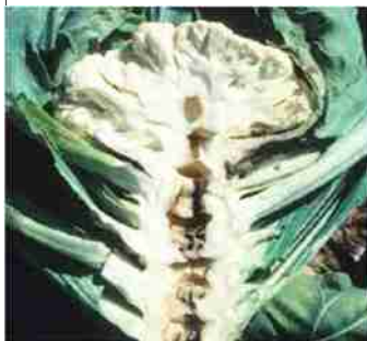
बोरान की कमी से फूल गोभी में होलों स्टेम