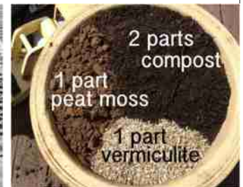
पौध तैयार करने के लिए विभिन्न प्रकार के माध्यम