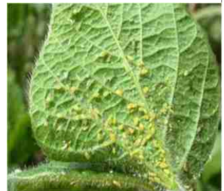
चेपा पौधों का रस चूसते हुए

पहचान : इस कीट के वयस्क हल्के रंग के होते हैं। कीट की पंख वाली अवस्था में इसका रंग भूरा होता है। ये लगभग 1.25 मि.मी. लंबे होते हैं। इसके शिशु दिखने में वयस्क के समान, लेकिन आकार में छोटे होते हैं। फसल पकने के बाद पंखदार वयस्क भी दिखाई देते हैं। इनके पंख पारदर्शी होते हैं, जिनमें काली नसें दिखाई पड़ती हैं।