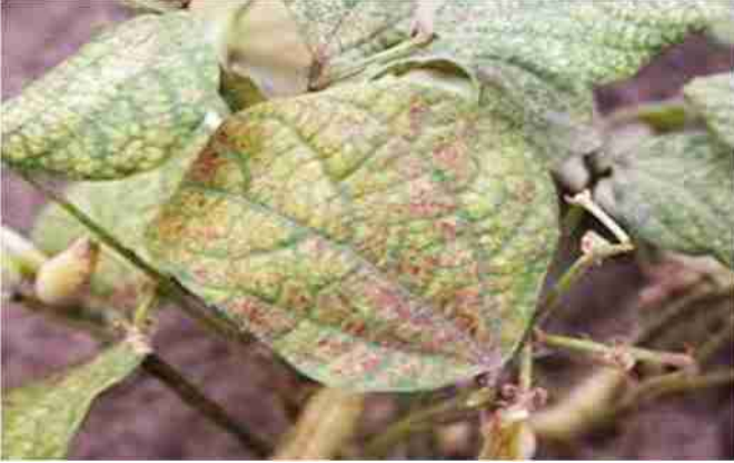
बरुथी कीट से प्रभावित पत्तियाँ

बरुथी कीट : इसका वैज्ञानिक नाम टेट्रानिकस निओक्लेडिनीकस है। यह ट्रोम्बिडिफॉर्मिस गण के टेट्रानिकिडी कुल का कीट है।