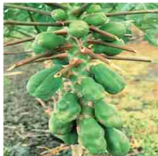
बोरान की कमी से पपीता में फलों में विकृति के लक्षण

तालिका : 1 बोरॉन रसायन एवं उनमें उपस्थित पोषक तत्व की मात्रा (%)