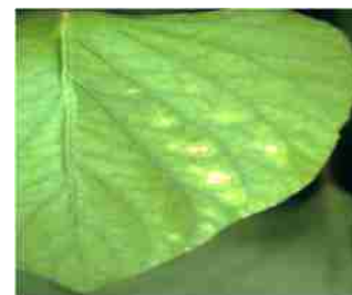
मोलिब्डिनम की कमी पत्तियों पर लक्षण

तालिका : 2 मोलिब्डिलम रसायन एवं अन्य उपस्थित पोषक तत्व की मात्रा