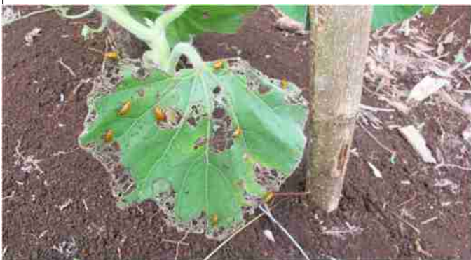
लाल कटू भृंग फूलों व पत्तियों में छेदकर के नुकसान पहुंचाते हुए

पहचान : इसका वयस्क भृंग चमकदार नारंगी रंग का होता है। यह लगभग 7 मि.मी. लंबा और 4.5 मि.मी. चौड़ा होता है। मादा, नारंगी अथवा पीले रंग के अंडों को पौधों के निकट जमीन में देती है। इसका ग्रब पीलापन लिए हुए सफेद होता है। इसका सिरा भूरे रंग का होता है। पूर्ण विकसित ग्रब लगभग 1.2 मि.मी. चौड़ा होता है। इनका प्यूपा भी जमीन में बनता है।