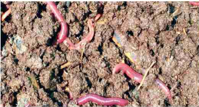
मृदा की उर्वरा शक्ति बढ़ाता है वर्मीकम्पोस्ट

भारत में पुराने समय से ही जैविक कृषि ही की जाती थी परंतु जनसंख्या वृद्धि के कारण अनाज की कमी को पूरा करने के लिए हरित क्रांति का आगमन हुआ, जिससे फसल की पैदावार में तो बढ़ोतरी हुई परंतु इससे भूमि की उपज क्षमता पर विपरीत असर पड़ा। वातावरण, पेयजल, स्वास्थ्य पर भी इसका दुष्प्रभाव पड़ा। इन सब चीजों को ध्यान में रखते हुए जैविक कृषि को बढ़ावा देने का प्रयास किया जा रहा है। विश्व में 154 देशों में जैविक कृषि को बढ़ावा दिया जा रहा है। कृषि उत्पादन में रसायन रहित पदार्थों, स्वस्थ जलवायु, पौधों व जमीन संरक्षण के लिए केवल जैविक खेती ही एक मात्र विकल्प है। जैविक खेती करने हेतु वर्मी कम्पोस्ट बनाने की प्रक्रिया में निम्नलिखित बातों पर ध्यान देना जरूरी होता है।