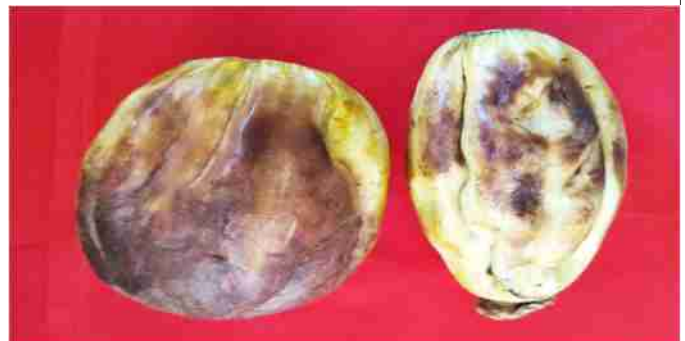
फल मक्खी का फलों पर प्रकोप

पहचान : इसका वयस्क लाल भूरे रंग का व वक्ष पर पीले रंग की मार्किंग होती है। फल मक्खी की मादा 6-7 मि.मी. आकार की होती है। नर अपेक्षाकृत छोटा होता है। मादा सफेद सिगार आकार के अंडे, कोमल, नरम फलों में 2 से 4 मि.मी. अंदर घुसकर देती है। लटावस्था मैगट मटमैले सफेद रंग की होती है। इसका अग्र भाग चौड़ा तथा पश्च भाग पतला होता है। लटें टांगरहित होती हैं। पूर्ण विकसित मैगट 9-10 मि.मी. लंबी व बीच से 2 मि.मी. चौड़ी होती है। प्यूपीकरण मृदा में सतह से 0.5 से 1 मि.मी. नीचे होता है।