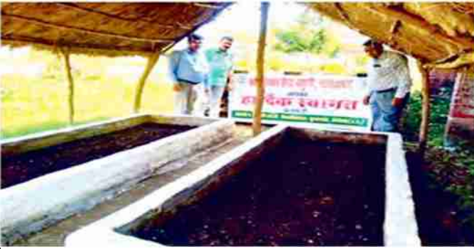
कम लागत में वर्मीकम्पोस्ट का उत्पादन