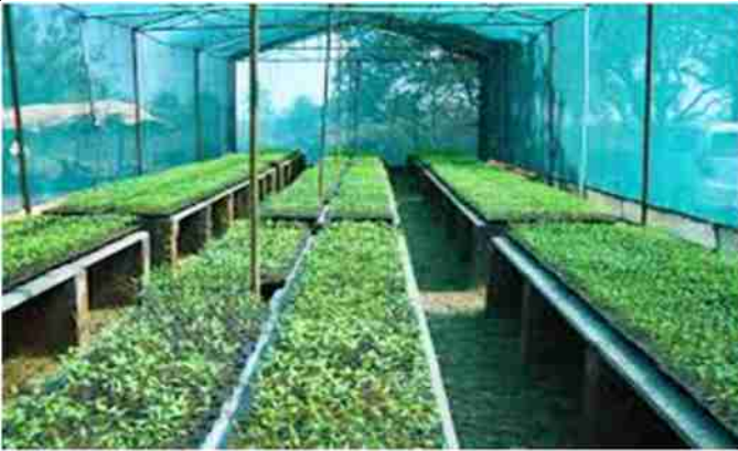
शेड नेट हाउस में सब्जियों की पौध तैयार करना

तैयार करने के लिए प्लास्टिक प्रो-ट्रे का उपयोग किया जाता है। इसमें यहां तक कि कद्दूवर्गीय सब्जियों की पौध को भी तैयार कर सकते हैं। जिसे परम्परागत विधि द्वारा तैयार करना संभव नहीं है।